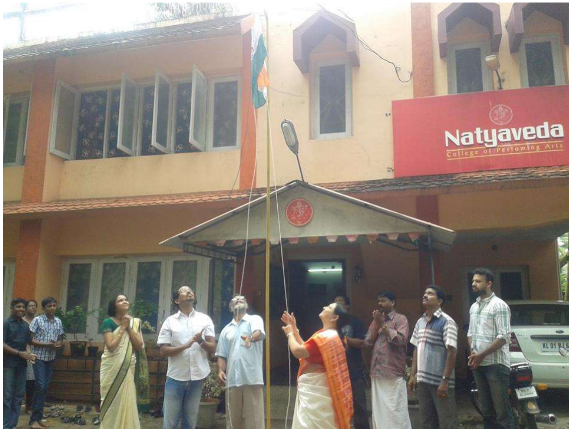
Preparing for a flag hoisting