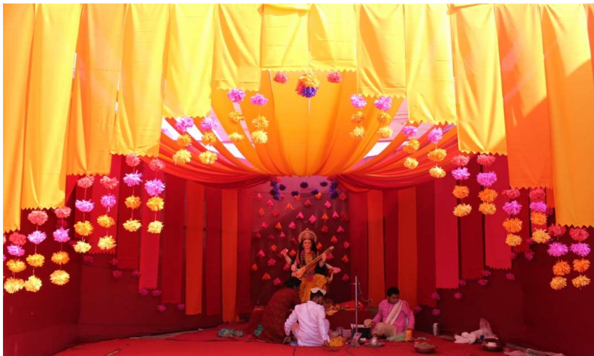
The stage set for Vasant Panchami pooja designed and executed by the students.