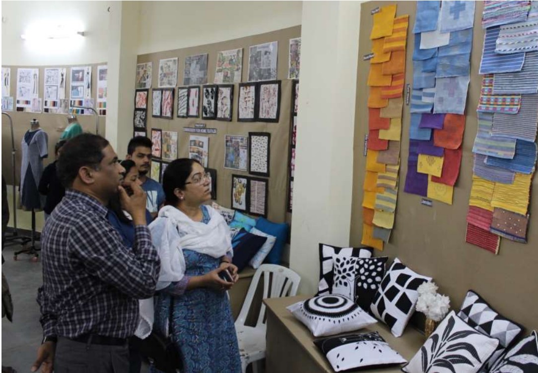
Hon'ble Vice Chancellor Prof. Mandavi Singh visits the textile & fashion design section of Visual Art Exhibition 2017.

18 th -20 th January 2017: Work of B.Voc Textile design & Fashion Design students work is exhibited at the Visual Art Exhibition 2017 organized by the university.