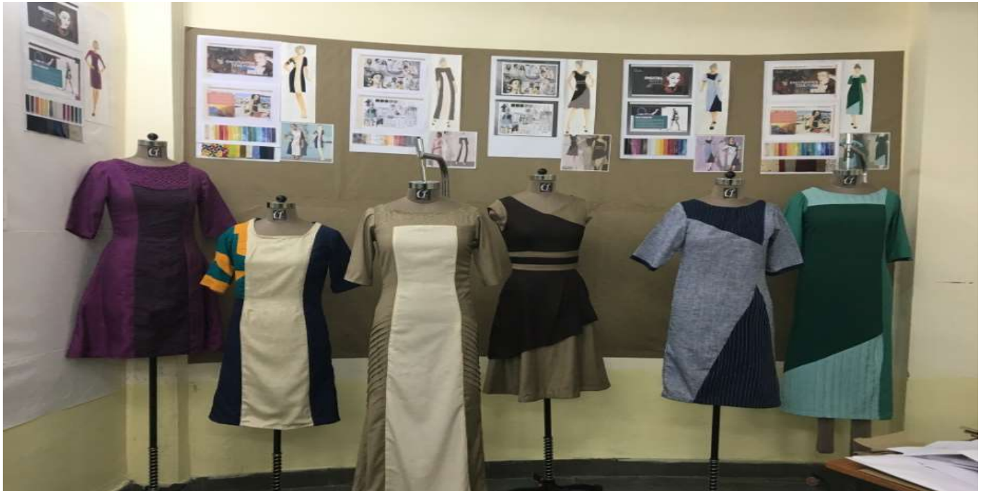
Garments designed and developed by the students of B.Voc Fashion Design 1 st February 2017 : Vasant Panchami pooja set design and execution done by the Design students of Department of Craft & Design.