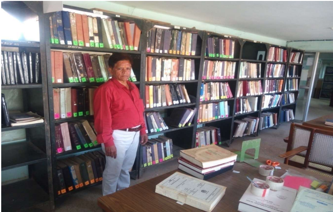
ग्रंथालय का शोध ग्रंथ एवं शोध पत्रिकाएं संदर्भ कक्ष।