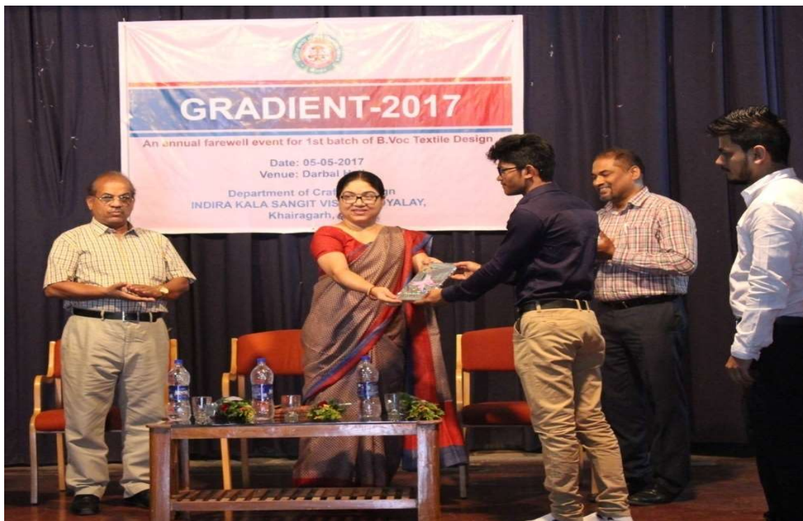
5 th May 2017: Gradient-2017 , an annual farewell event for 1 st batch of B.Voc. Textile Design students organized by Dept. of Craft & Design. The graduating students shared their Industry Internship work and experiences with the students and teachers of the department of craft & design